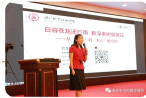
深圳职业技术大学