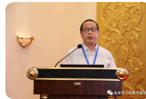
黄冈职业技术学院