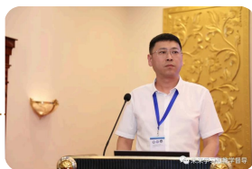
黑龙江农业职业技术学院

但材料中的“教学资料管理”内容，值得商榷，是不是应该是相关职能部门的工作，应避免督导工作既当运动员又当裁判员。