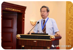
○ 黑龙江中医药大学