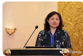
辽宁轨道交通职业学院