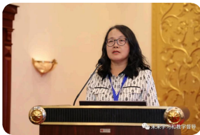
山东外国语职业技术大学