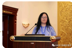
贵州轻工职业技术学院