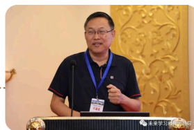
广州城市职业技术学院