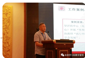
江西科技师范大学