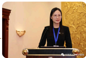
辽宁轻工职业学院