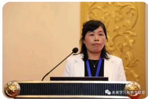
杭州科技职业技术学院